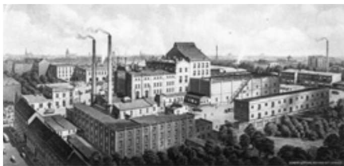
Bürgerliches Brauhaus Breslau Aktiengesellschaft