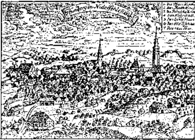
„Grünberg in Niederschlesien“ von Löbtenz aus gesehen. Anonymer Kupferstich, vor 1748.

Wein-, Kunst- und Bildungsabteilung eingerichtet. Ende der 60er Jahre erhielt das Grünberger Museum den Namen Muzeum Ziemi Lubuskiej (Museum des Lebusener Landes). Seit der zweiten Hälfte der 70er Jahre sind aus der ethnographischen, archäologischen und militärischen Sammlung jeweils drei selbstständige Museen entstanden. Die Tätigkeit des Museums konzentrierte sich in den 80er, 90er Jahren schließlich auf den Ausbau der Bestände im Bereich der zeitgenössischen polnischen Kunst. Derzeit befaßt sich die Einrichtung vor allem mit der Vervollständigung der Sammlung alter Kunst und moderner Malerei, sowie mit der Kulturgeschichte der Stadt und ihrer Umgebung.