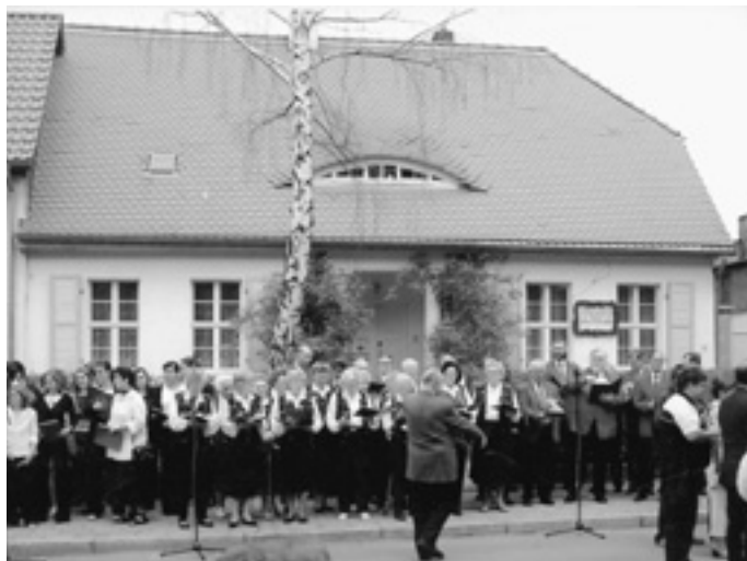
Das Eichendorff-Haus in Köthen mit den zum Singen „angetretenen“ Chören.

Tag eine „Festakademie“ im Spiegelsaal des Schlosses mit musikalischen, literarischen und tänzerischen Beiträgen sowie einem Vortrag von Prof. Dr. Eckhard Grunewald von der Universität Oldenburg und Vorstandsmitglied der Eichendorff-Gesellschaft; auch ein Ururenkel des Dichters kam dabei zu Wort.