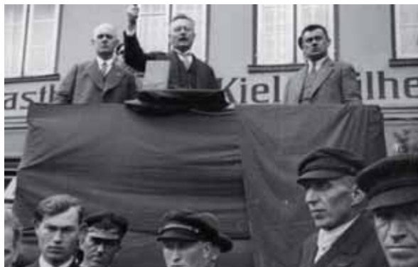
Paul Löbe als Redner bei einer Kundgebung in Eutin, 1927.

Als Demokraten und Abgeordnete des letzten freien Reichstags wurden sie in der Zeit des Nationalsozialismus verfolgt. Nach dem Zweiten Weltkrieg verloren sie endgültig ihre Heimat. Paul Löbe konnte in der Bundesrepublik sein politisches Wirken fortsetzen. Er eröffnete als