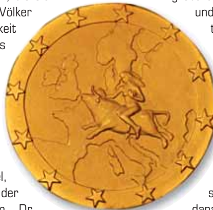
Die Medaille „Mérite Européen“ zeigt auf der Vorderseite den geografischen Umriss Europas mit Jupiter in Stiergestalt, die Göttin Europa tragend, und ringsum zwölf Sterne (wie auf der Europaflagge oder den Euro-Münzen).

• In Bezug auf die dritte christliche Tugend, den Glauben, zitierte Pöttering den Erzbischof mit den Worten: „Will sich Europa ernsthaft als ausgesöhnte und vereinigte Werte- und Kulturgemeinschaft etablieren, so darf es seine christlichen Wurzeln nicht verleugnen“, denn aus ihnen ergebe sich der Primat der Menschenwürde, die nach christlichem Verständnis von Gott geschenkt wurde. Im Kern sei die Einigung Europas ein Werk verwirklichter Menschenwürde in einer nach Krieg und Leid erneuerten Ordnung der Staaten und Völker unseres Kontinents. Nach Nossols Auffassung komme den christlichen Kirchen im zukünftigen Europa „als Raum der Integration