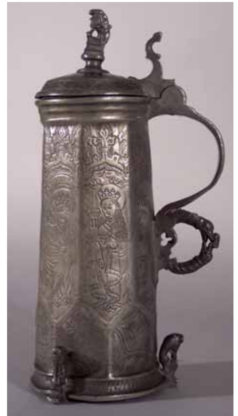
Die schlesische „Schleifkanne“ von 1491.

Kannen dieser Art wurden bei Festgelagen der Zünfte benutzt. Die historische Bezeichnung „Schleifkanne“ ist nicht sicher gedeutet. Vielleicht rührt sie von Bräuchen bei der Lossprechung von Gesellen her. Es war üblich, diese zu traktieren, zu „schleifen“, wobei der frischgebackene Geselle seinen neuen Kollegen noch eine Kanne Bier zu stiften hatte. Eine andere Erklärung bezieht sich auf das enorme Gewicht der gefüllten Kannen, die nur auf dem Tisch gezogen (geschleift) werden konnten. Später kamen deshalb Kannen in Gebrauch, bei denen am Boden ein Spundloch mit Zapfhahn eingelassen war.