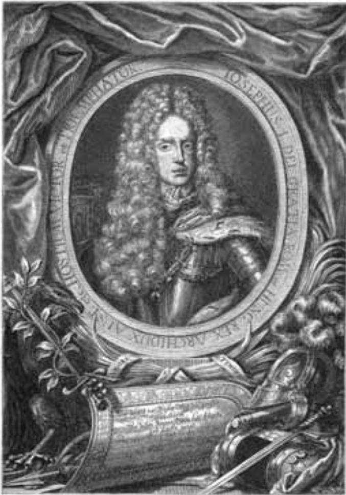
Kaiser Joseph I. (reg. 1705-1711). Druck nach einem zeitgenössischen anonymen Kupferstich.