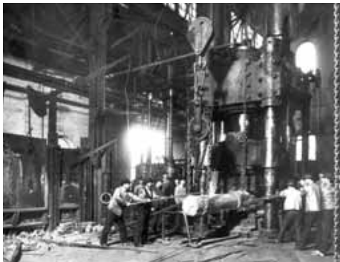
Presse in den Huldshinskywerken, Gleiwitz, um 1914, Fotograf unbekannt, © Museum Gleiwitz.