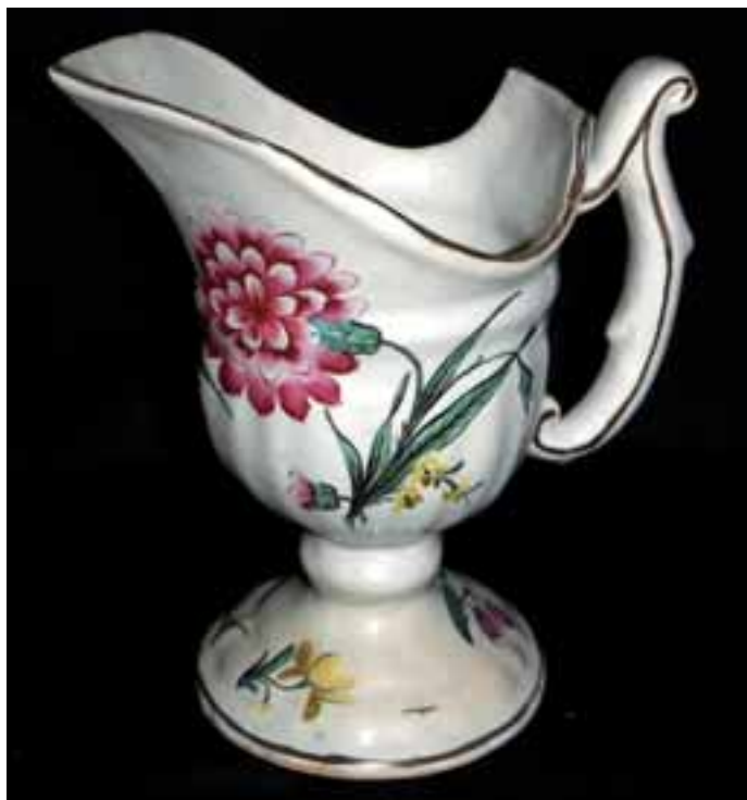
Helmkanne mit Nelkendekor, Fayence, Proskau, 2. Periode (1769-1783), weiße Glasur, Bemalung in bunten Muffelfarben.