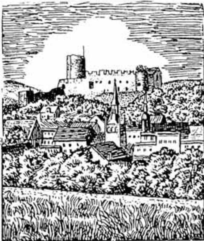
Bolkenhain mit der Bolkoburg.

Zu der Aufführung auf der Bolkoburg waren bedeutende Persönlichkeiten aus dem Geistesleben Schlesiens erschienen, und es wird berichtet, daß die Leistung der Schauspieler mit lebhaftem Beifall quittiert wurde. Der