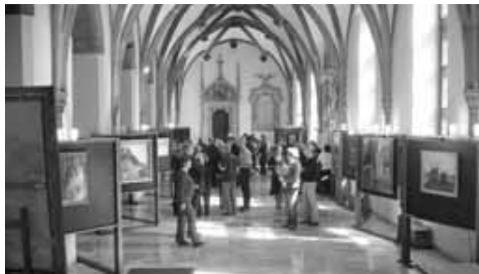
Ausstellungseröffnung im Großen Saal des Breslauer Rathauses.

Die Leiterin des Museums für schlesische Landeskunde, Nicola Remig, dankte für die gute Zusammenarbeit mit den Breslauer Museumskollegen,