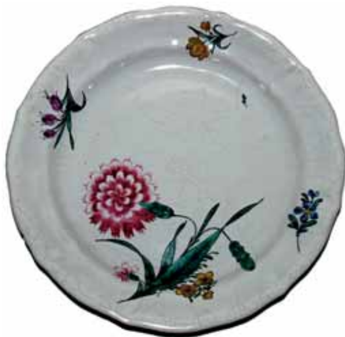
Teller, Fayence, Proskau, um 1783, weiße Glasur, Blumendekor mit Nelkenmotiv, Bemalung in bunten Muffelfarben.