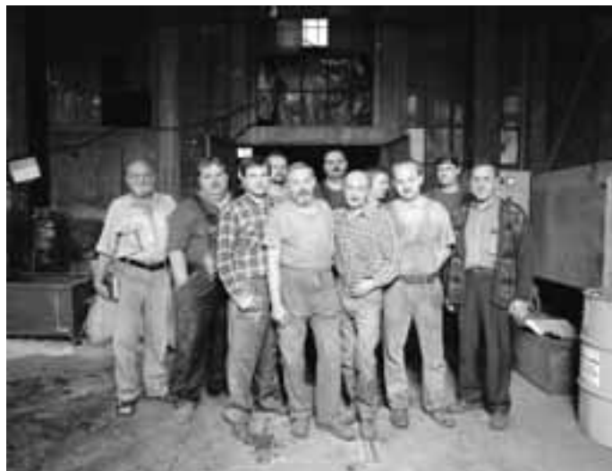
Arbeiter der Gleiwitzer Kunstgießerei GZUT, 2005